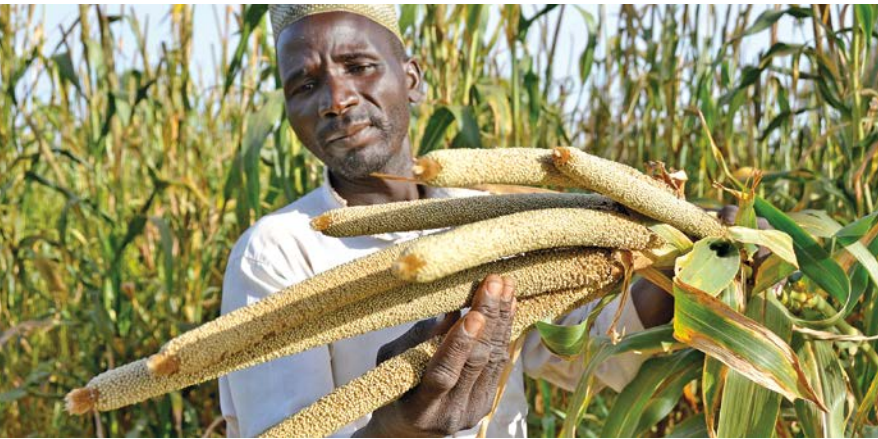
HEKS Projekt Niger: Hirse