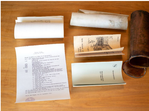
Verschiedene Dokumente aus dem Jahr 1963 kommen zum Vorschein.