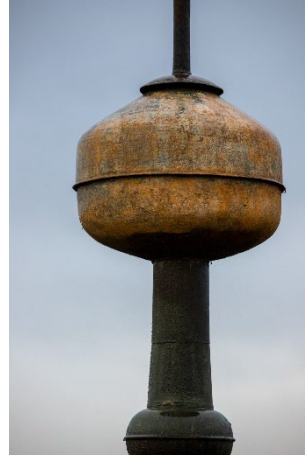
Der sog. Turmknopf bzw. die Turmkugel