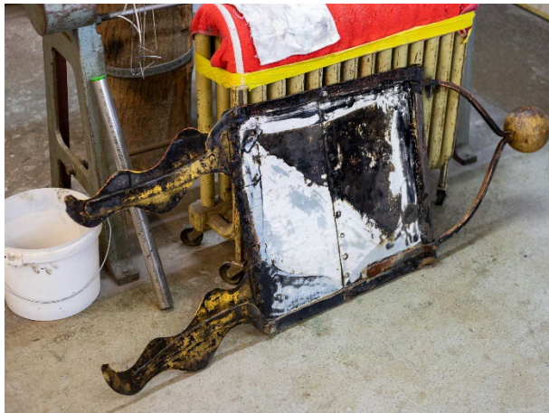
Das Motiv auf der Wetterfahne ist kaum noch zu erkennen.