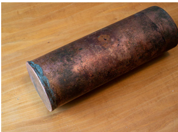
Die zugelötete Zeitkapsel.