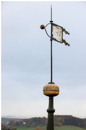
Die Wetterfahne vor ihrer Demontage.