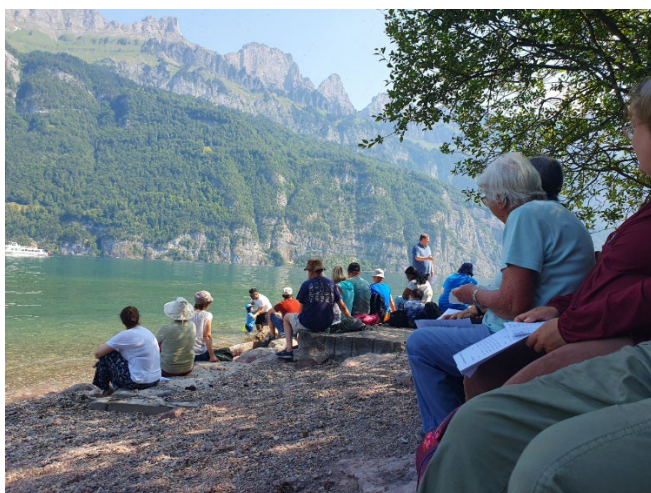
Der Sonntagsgottesdienst am Walensee im Gemeindefestwochenende 2023