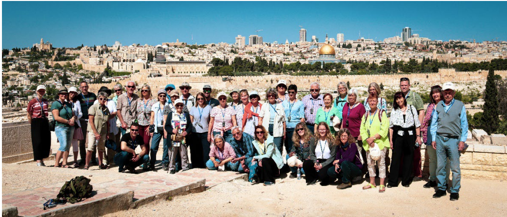
Gemeindereise im Frühling 2023 nach Israel.