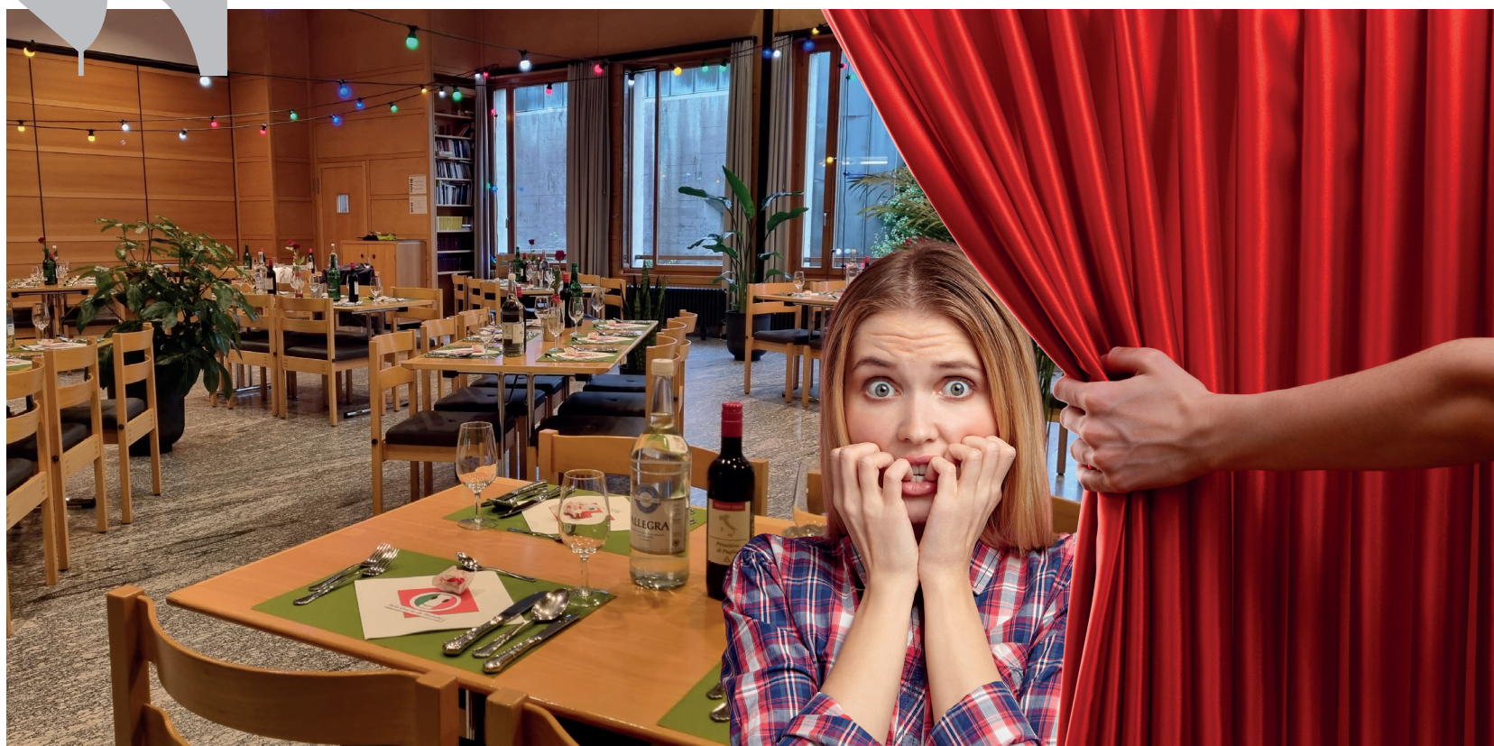
Mutig auftreten – Lampenfieber überwinden!