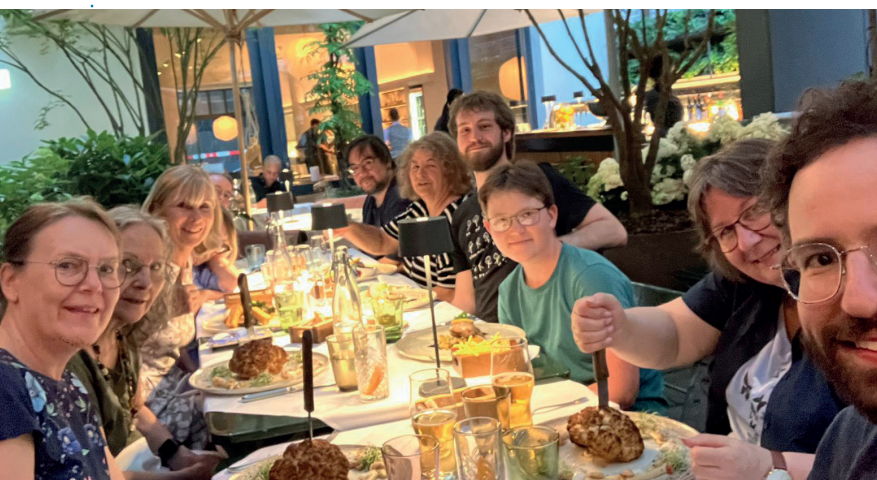
Das Kernteam von FRIDAYS

Ferienlager für Menschen mit Migrationshintergrund