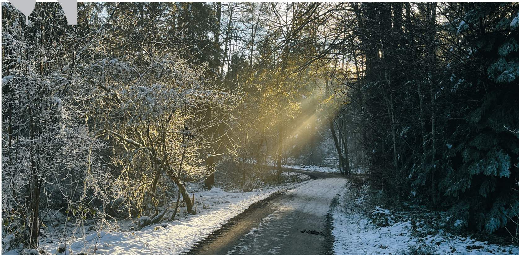
Ein Licht erhellt unsern Weg.