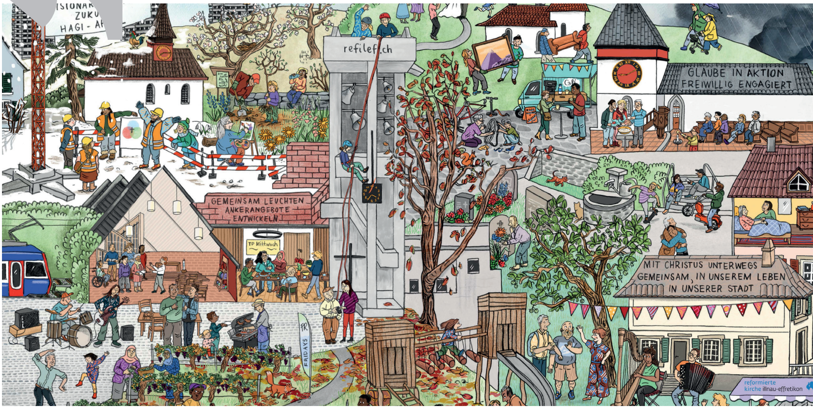
Illustration: Andrea Peter